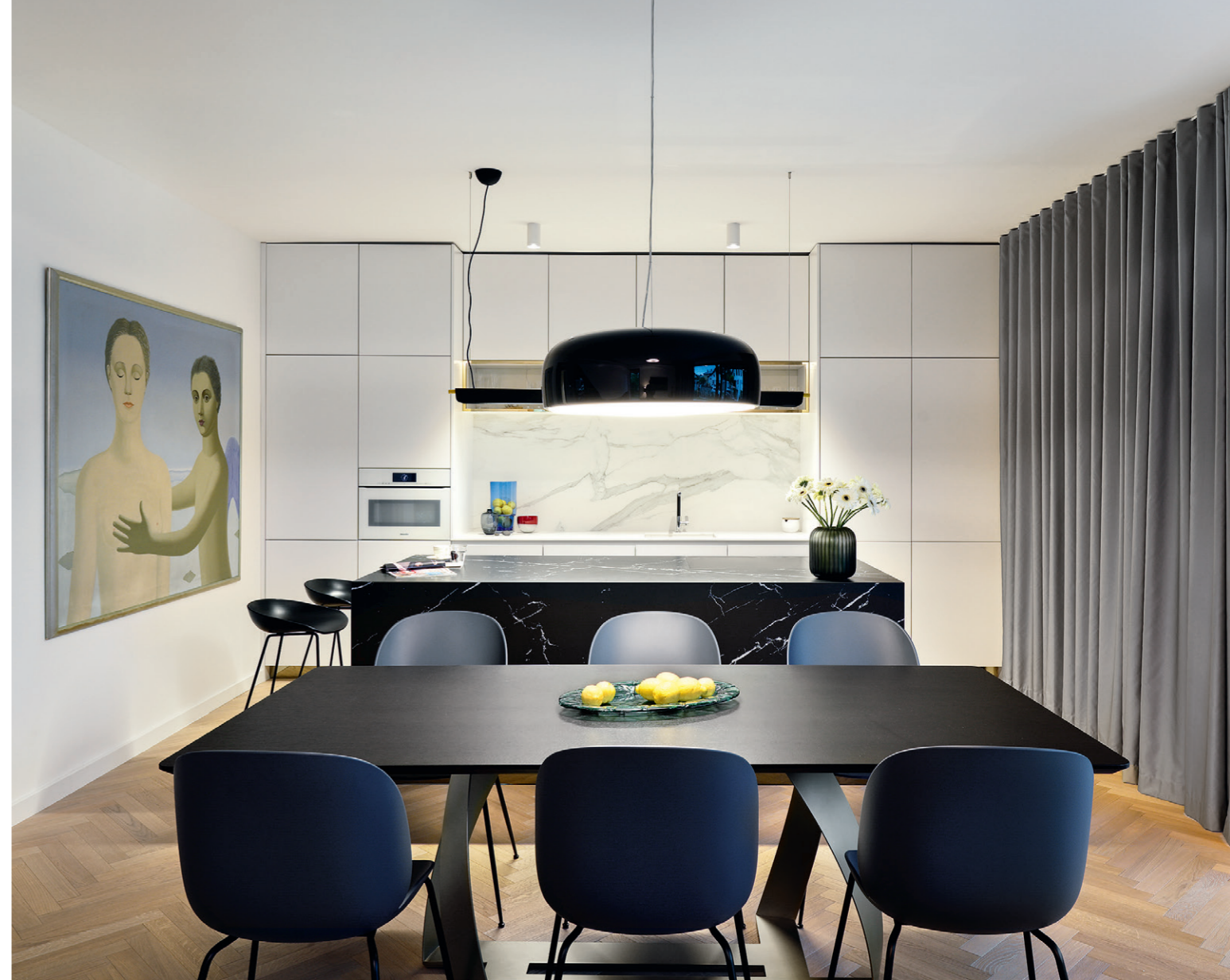
A szlovén kortárs festőművész alkotása adott ihletet a térbeli kifinomultsággal és formai letisztultsággal jellemezhető belsőépítészeti koncepcióhoz.