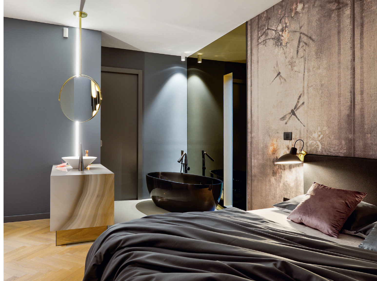
A legspeciálisabb belsőépítészeti megoldást a szülői lakrész kapta, ahol az intim, keleties hangvétel a modern formavilággal összhangot képez.