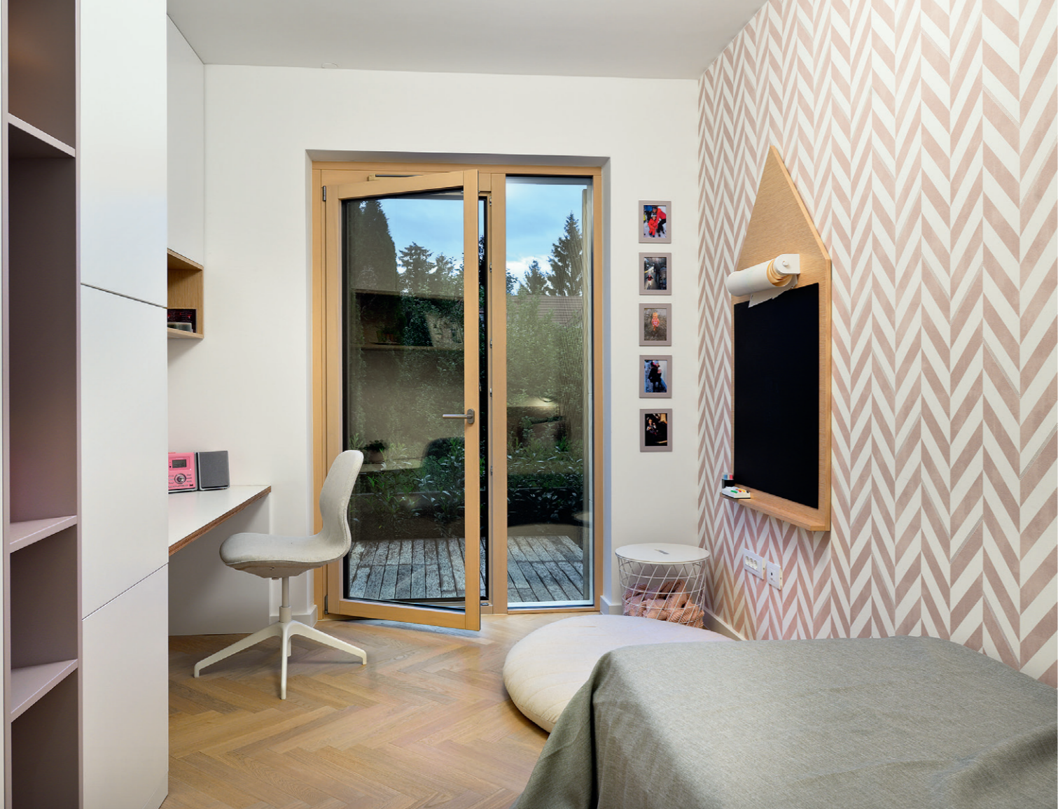
A gyerekszobákban az azonos bútorelemek eltérő színezése és a tapéták hangulatteremtők, míg a fürdőben a kőhatású burkolat hangsúlyos.